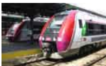
Rame automotrice SNCF bi-mode -électrique et diesel et bi-courant

La forte augmentation de la consommation du pétrole depuis la seconde guerre mondiale a provoqué l'appauvrissement des réserves et a eu des effets négatifs sur l'environnement. Cet appauvrissement des réserves a entraîné une hausse du prix du pétrole et les émissions de CO 2 résultant de sa combustion ont fortement contribué au réchauffement climatique.