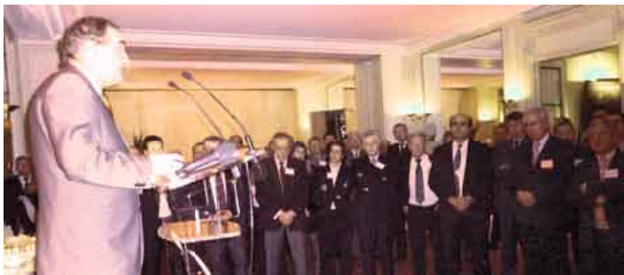
Les vœux du Président de l'AFFI