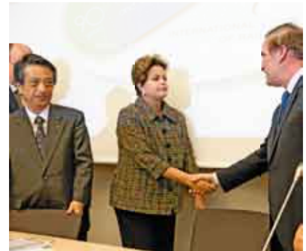
Remerciements à l'issue du discours

La Présidente de la République du Brésil s'est également exprimée au sujet du rôle de l'UIC : « Je crois qu'il est important d'établir un grand dialogue avec le Brésil. Celui-ci permettra d'assurer la stabilité et la sécurité des investissements, et de créer les conditions indispensables pour que le Brésil puisse non seulement structurer son système de transport de façon à ce qu'il relève les défis du 21 e siècle, mais, plus encore, que la population puisse disposer de transports plus efficaces, pour les voyageurs comme pour le fret ».