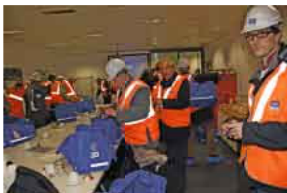
L'équipement avant les visites