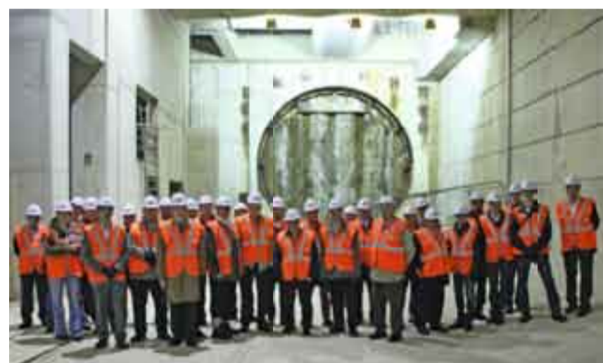
Le groupe devant le débouché du tunnelier