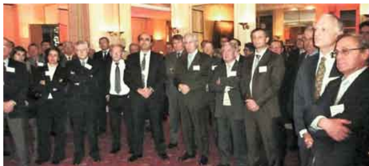
Plus de 140 adhérents ont participé à la cérémonie

C'est dans cette perspective qu'à mon tour je formule des vœux pour l'AFFI, afin que l'Association poursuive et intensifie les opportunités de rencontres entre personnes et la diffusion des connaissances. Elle continuera ainsi à contribuer à l'excellence de la filière ferroviaire française et au développement de ses activités en France et à l'international."