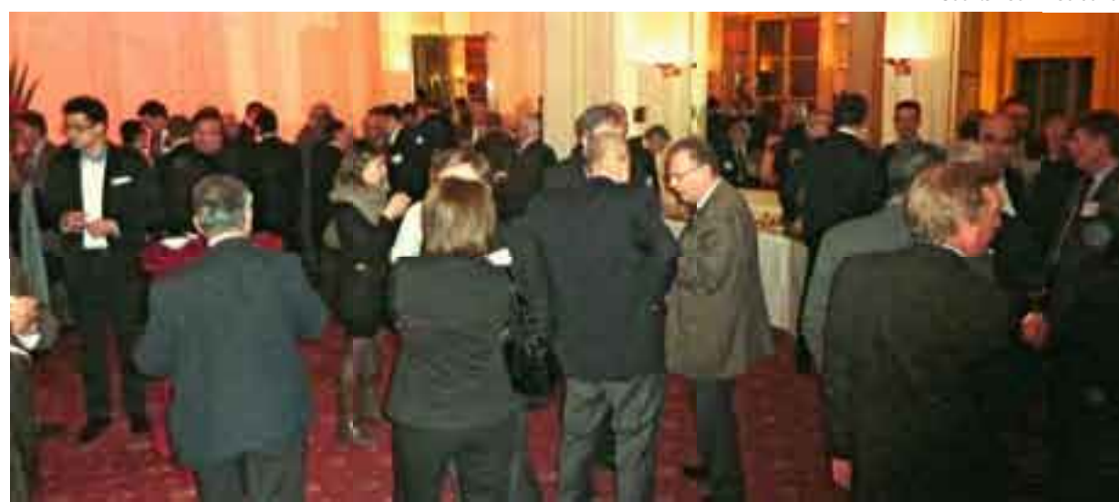
Cocktail de fin de soirée