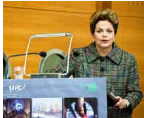
Madame Dilma Rousseff, Présidente de la République du Brésil

Madame Dilma Rousseff, Présidente de la République du Brésil, était, le 12 décembre, l'invitée d'honneur de l'Union internationale des chemins de fer qui célébrait son 90 e anniversaire à l'occasion de son Assemblée générale à Paris. Evoquant la situation dans son pays, elle a souligné que « le mix entre les modes de transport était actuellement déséquilibré. Un pays comme le Brésil ne peut pas être fondamentalement desservi uniquement par des routes. Il faudrait trouver le moyen de pouvoir combiner les différents modes de transport entre eux : routes, voies fluviales et chemins de fer ».